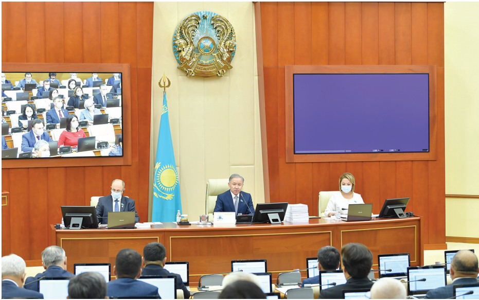
Мәжіліс Спикері Нұрлан Нығматулиннің төрағалығымен палатаның VII шақырылымның екінші сессиясындағы алғашқы жалпы отырысы өтті.

Күн тәртібіндегі мәселеге кіріспес бұрын Мәжіліс Төрағасы депутаттық корпусының назарын Мемлекет басшысы Қасым-Жомарт Тоқаевтың Қазақстан халқына Жолдауында айтылған басымдықтарына тоқталды.